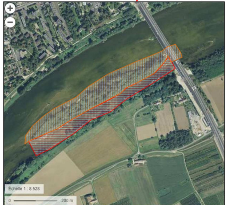
Illustration à titre d'exemple, d'autres sites peuvent faire l'objet d'une protection temporaire, alors signalés par la présence de panneaux sur site.